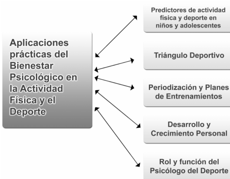
Figura 3. Aplicaciones prácticas del bienestar psicológico en la actividad física y el deporte

el futuro, autovaloración de la aptitud deportiva, forma física percibida y salud percibida predicen positivamente tanto en chicos como en chicas, la práctica del deporte y la práctica del ejercicio físico intenso. De todas maneras se hace necesario evaluar el bienestar realizando diferencias de género, ya que como se ha indicado en otros estudios (Brustad, 1996) las diferencias podrían ser sustanciales (ver Figura 3).